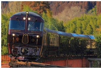
九州旅客鉄道株式会社 クルーズトレイン 「ななつ星 in 九州」