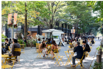
三菱地所株式会社 街のブランド化に向けた丸の内再構築の地域協働型プロデュース