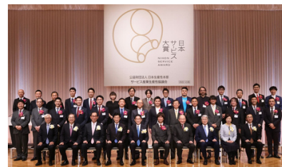
▲ 第4回日本サービス大賞 表彰式の様子

「日本サービス大賞」とは、日本国内の革新的で優れたサービスを表彰し広く普及させることにより、サービス産業の発展と生産性を向上させることを目的とした表彰制度です。これまでに109件の優れたサービスが受賞しています。