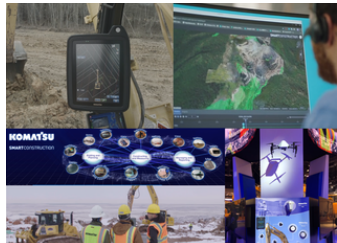
株式会社小松製作所 土木建設サービス全体のデジタル業態革新「スマートコンストラクション」