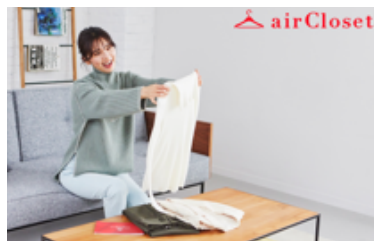
▲ 第4回日本サービス大賞 内閣総理大臣賞受賞 株式会社エアークローゼット

自社サービスの 現状を再整理し、 改革のための新しい 気づきを得る ことができる