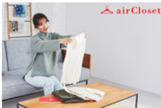
株式会社エアークローゼット スタイリストが提案する月額制ファッションレンタルサービス「airCloset」