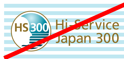
パターンや絵柄のある背景にシンボルロゴを表示してはいけません