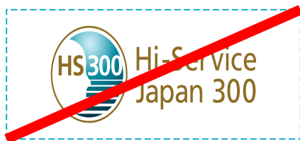
シンボルロゴを変型させてはいけません