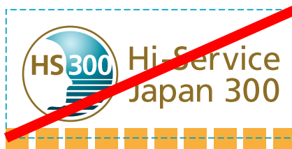
シンボルロゴと他の要素を隣接させてはいけません