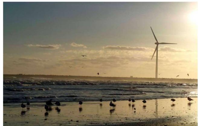
▲市民風車なみまる（茨城県神栖市）