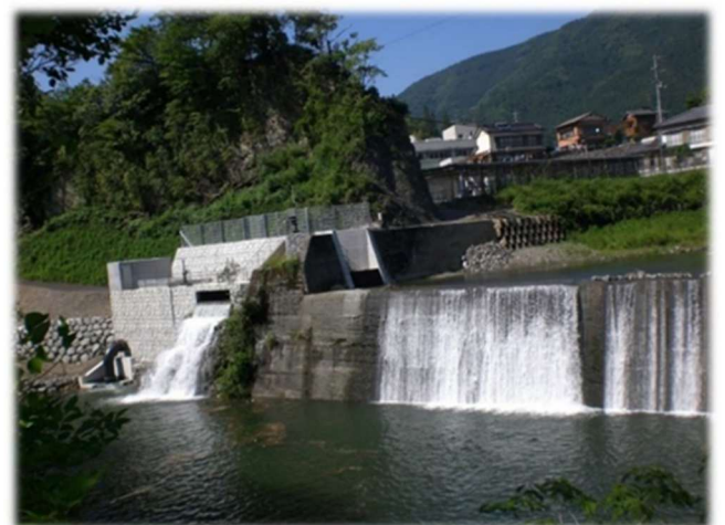
▲梶原町水力発電所（高知県梶原町）