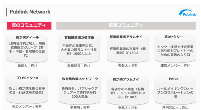
▲様々なコミュニティを通して連携を促す