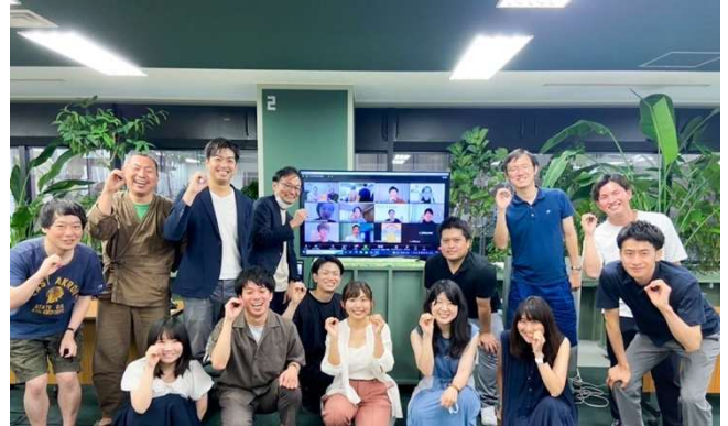
▲ゼロセク・インキュベーションプログラムでは省庁の垣根を越えて様々な企画を共創している