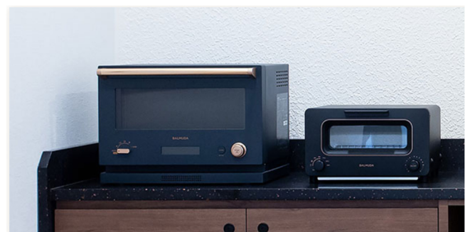
▲共同利用施設には、洗濯乾燥機や電子レンジ、トースターなどを設置