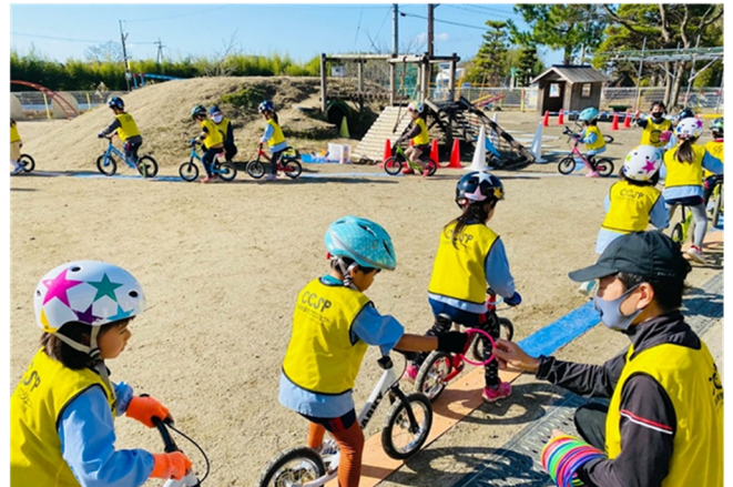
▲滋賀県日野町での実施例。安全・快適な自転車利用のための子ども向け教育プログラムを開発・実施

企業が自治体からアイデアを募集するという、従来の官民連携を逆ささせるサービスモデルを提案している。革新的で優れた価値提案を行ってサービスイノベーションを実現している