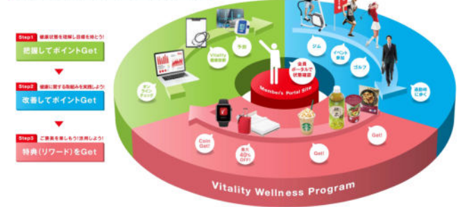
▲行動変容を促す3つのステップ