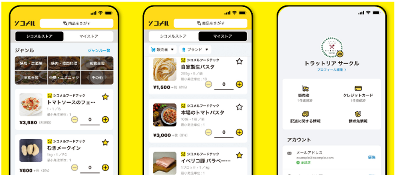
▲シコメルアプリでは、マイストア（自店の仕込み済み商品オーダー機能）、シコメルストア、受発注機能の3機能を主に活用できる

「独自メニューは店舗で調理するもの」という発想を転換し、小さな飲食店でも食材の仕込みをアウトソーシングできるサービスを提供。革新的で優れた価値提案を行ってサービスイノベーションを実現している