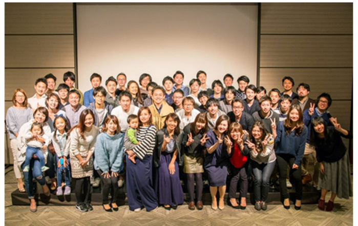
▲アトラエは役職を廃した組織運営でも注目されている