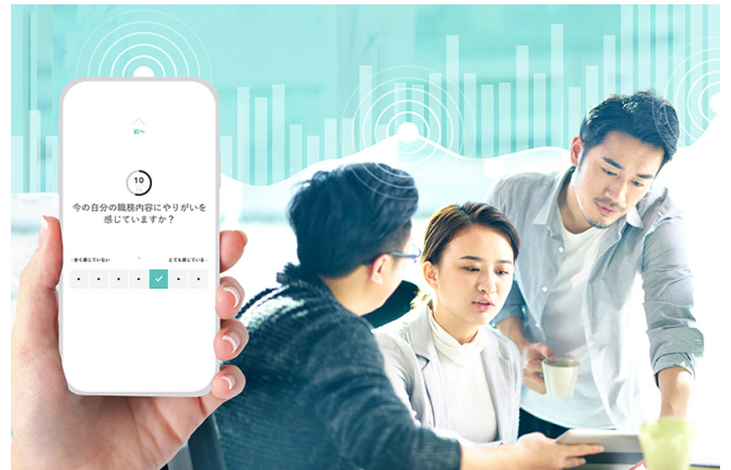
▲スマホでの回答項目の例