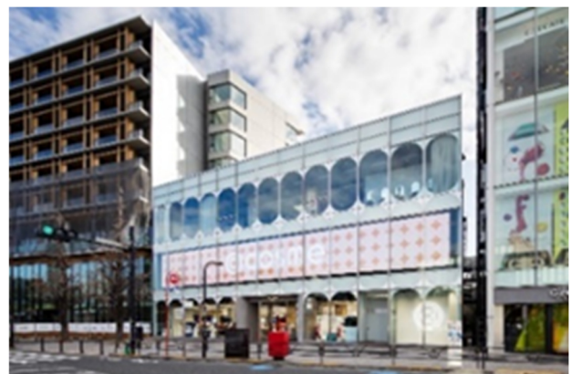
▲JR原宿駅前の旗艦店「@cosme TOKYO」