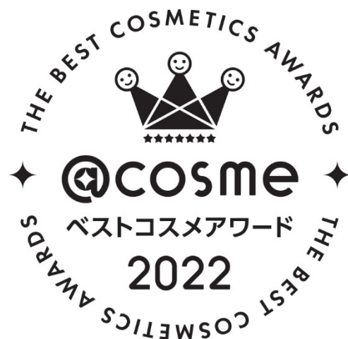
▲6月と12月の年2回、各半期内で最も消費者に支持された美容商品を表彰する。受賞ロゴが付いた商品は売り上げが数倍になることもある