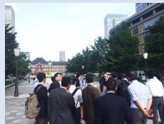
三菱地所 東京・丸の内エリアの視察