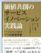
村上輝康、松井拓己 編著