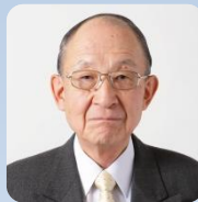
代表幹事 茂木 友三郎 (公財)日本生産性本部 会長 キッコマン(株) 取締役名誉会長 取締役会議長