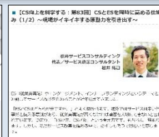
連載コラム「サービスを科学する」