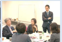
SPRING Café 「CSを語ろう」 ※法人会員限定