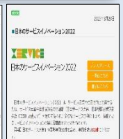
ベストプラクティス事例紹介

● 経営「なんでも」相談窓口（初回無料） 経営戦略・人材育成等について専門家がアドバイス！